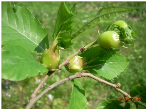
Galle su germoglio