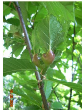
Galla su foglia