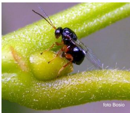
Femmina adulta in ovodeposizione su gemma

Il decorso del ciclo biologico è influenzato da fattori climatici, legati ad esempio all'altitudine e all'esposizione degli impianti, nonché alla diversa precocità vegetativa delle varietà coltivate.